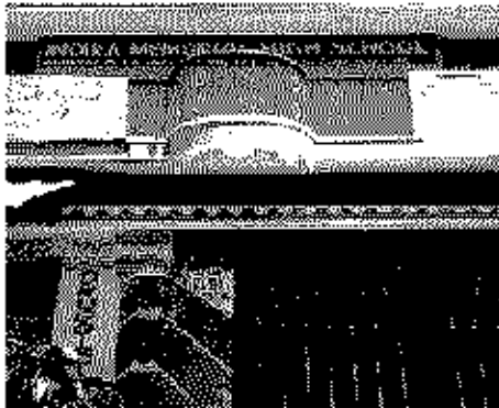
Polling Station Building Front View