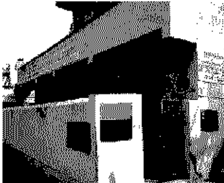
Polling Station Building Front View