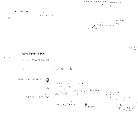
Google Map View