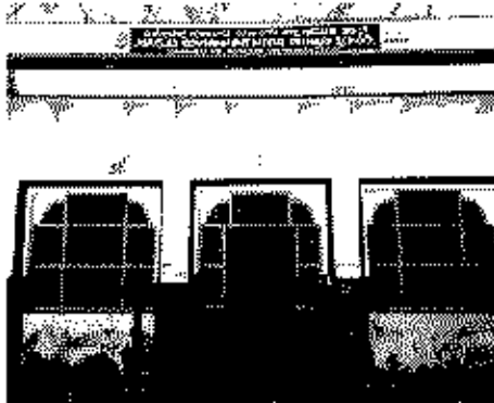
Polling Station Building Front View