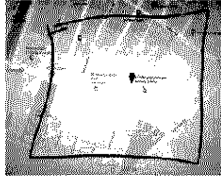
Google Map View