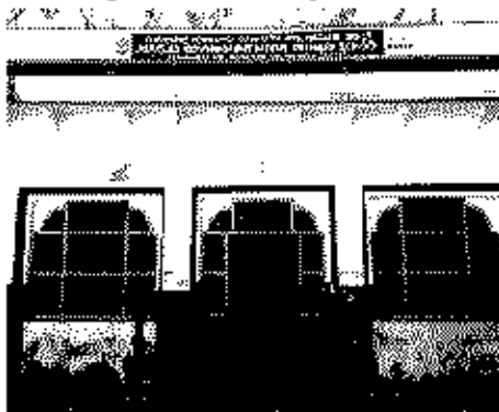
Polling Station Building Front View