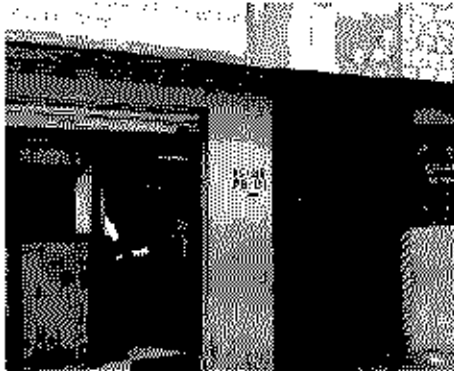
Polling Station Building Front View