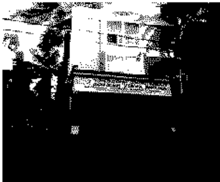
Polling Station Building Front View