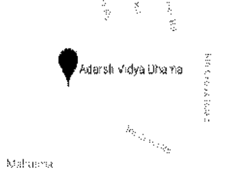
Google Map View