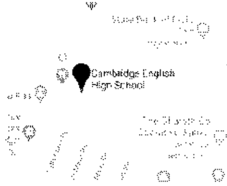
Google Map View