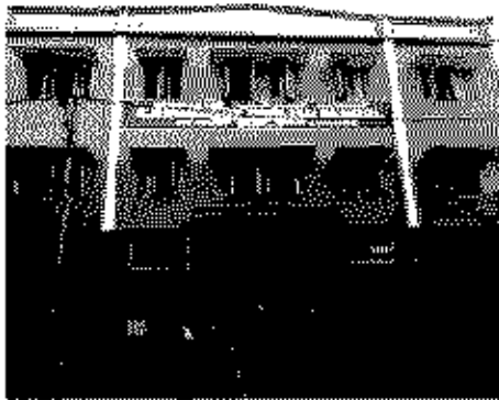
Polling Station Building Front View