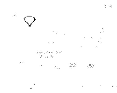
Google Map View