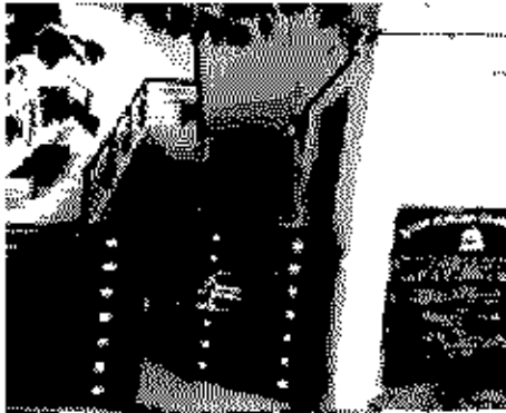
Polling Station Building Front View