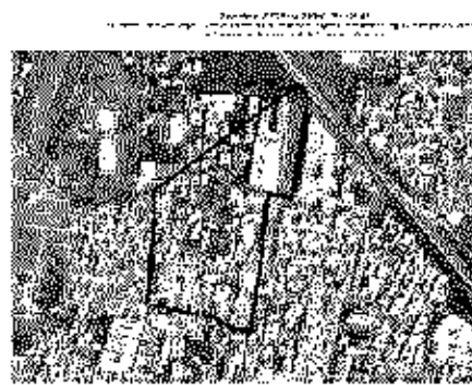
Google Map View