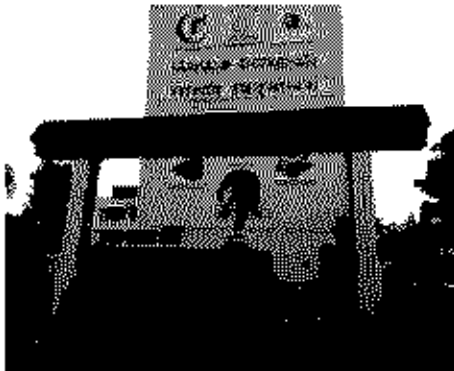
Polling Station Building Front View