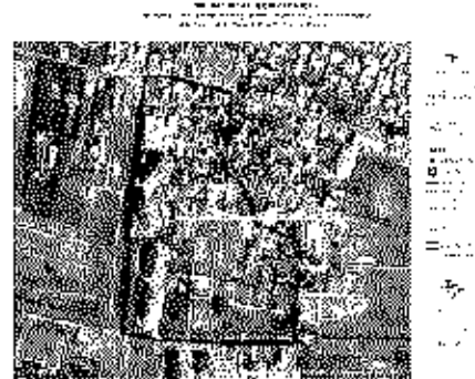
Google Map View