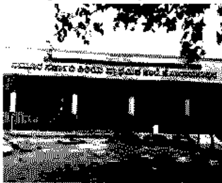
Polling Station Building Front View